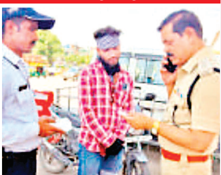
शामिल रहे. यातायात पुलिस का कहना है कि नियमों की अनदेखी करने वालों पर लगातार कार्रवाई जारी रहेगी, ताकि सड़क हादसों पर नियंत्रण पाया जा सके.

पुलिस ने बताया कि संबंधित चालकों के ड्राइविंग लाइसेंस निरस्तकरण और वाहनों के रजिस्ट्रेशन रद्द करने के लिए परिवहन विभाग को रिपोर्ट भेजी जा रही है. वहीं पुलिस के अनुसार, नशे में दो पहिया वाहन चलाने वालों पर भी पुलिस ने सख्ती दिखाई. 11 और 12 अप्रैल को चलाए गए सघन चेकिंग अभियान में 218 वाहन चालकों की जांच में 185 के खिलाफ मोटर व्हीकल एक्ट के तहत कार्रवाई कर वाहन जब्त किए.