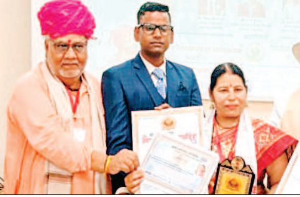
उपस्थित थे। समारोह में लोक गायिका को प्रशस्ति पत्र और स्मृति