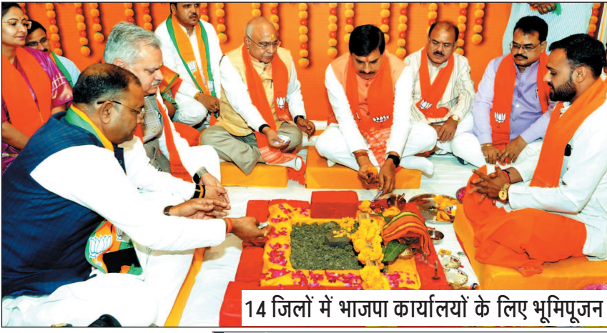
14 जिलों में भाजपा कार्यालयों के लिए भूमिपूजन