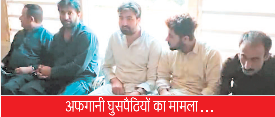
अफगानी घुसपैठियों का मामला ...

लोक अध्यक्ष के आगमन को लेकर किया निरीक्षण सिंगोली। दिगंबर जैन समाज द्वारा 2 से 7 अप्रैल तक पंचकल्याणक महोत्सव का आयोजन किया जा रहा है। पंचकल्याणक महोत्सव समिति ने लोकसभा अध्यक्ष ओम बिरला से मिलकर उन्हें पंचकल्याणक महोत्सव में आने का निमंत्रण दिया था। लोकसभा अध्यक्ष ओम बिरला ने सहर्ष स्वीकार करते हुए आयोजकों को सिंगोली आने की स्वीकृति प्रदान की थी। बताया जा रहा है कि 7 अप्रैल को लोकसभा अध्यक्ष ओम बिरला का सिंगोली आना लगभग तय है। लोकसभा अध्यक्ष के सिंगोली आने के कार्यक्रम की सूचना मिलने पर शनिवार को अपर कलेक्टर वी एस कनेश सिंगोली पहुंचे और कार्यक्रम स्थल पर सुरक्षा व्यवस्थाओं का निरीक्षण किया। इस दौरान आयोजकों द्वारा बुलाए गए हेलीकॉप्टर को उड़ाने को लेकर श्री कनेश ने कंपनी मैनेजर को आवश्यक निर्देश दिए तथा सुरक्षा मानकों का पूर्ण रूप से ध्यान रखने की हिदायत दी।