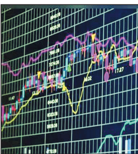
प्रतिशत) की मजबूती के साथ

मुंबई, 1 अप्रैल. ईरान युद्ध जल्द समाप्त होने की उम्मीद में घरेलू शेयर बाजारों में बुधवार को शुरुआती कारोबार में जबरदस्त तेजी देखी गयी और बीएसई के संसेक्स 1,900 अंक से ज्यादा उछल गया. संसेक्स 1,814.88 अंक की बढ़त के साथ 73,762.43 अंक पर खुला और कुछ ही देर में पिछले कारोबारी दिवस की तुलना में करीब 1,969 अंक ऊपर 73,916 अंक पर पहुंच गया. खबर लिखे जाते समय यह 1,648.46 अंक (2.29