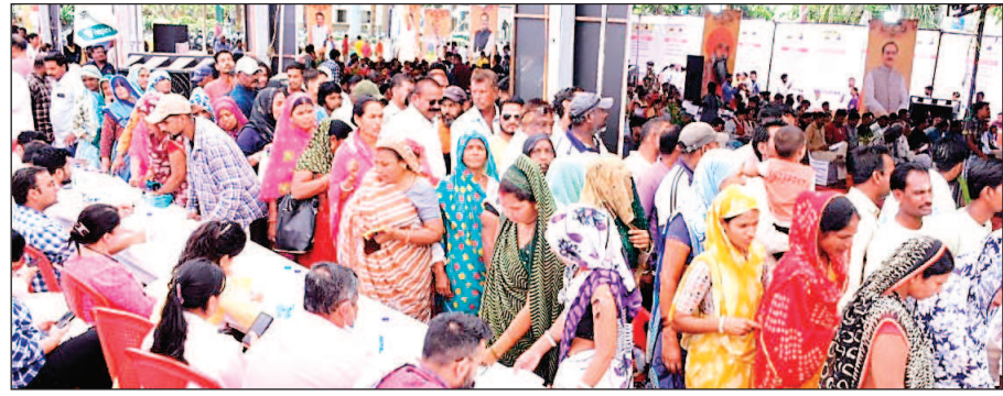
अधिभार की राशि 50 हजार रुपये तक बकाया है, उनमें अधिभार में 100 प्रतिशत तक की छूट दी जाएगी। जिन प्रकरणों में कर एवं अधिभार की राशि 50 हजार रुपये से अधिक और 1 लाख रुपये तक है, उनमें अधिभार में 50 प्रतिशत तक की छूट मिलेगी। वहीं जिन प्रकरणों में बकाया राशि 1 लाख रुपये से अधिक है, उनमें अधिभार में