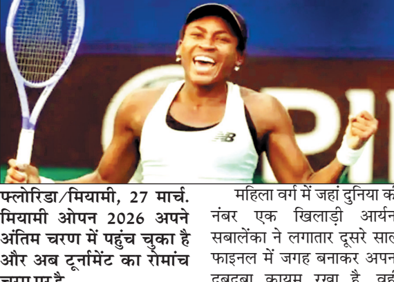
महिला वर्ग में जहां दुनिया की नंबर एक खिलाड़ी अर्यना सबालेंका ने लगातार दूसरे साल फाइनल में जगह बनाकर अपना दबदबा कायम रखा है, वहीं

अमेरिका की कोको गाँफ ने पहली बार इस प्रतिष्ठित टूर्नामेंट के खिताबी मुकाबले में प्रवेश कर इतिहास रच दिया है. पुरुष वर्ग में जानिक सिनर और अलेक्जेंडर ज्वेरेव के बीच होने वाला सेमीफाइनल मुकाबला भी चर्चा का केंद्र बना हुआ है. सबालेंका ने सेमीफाइनल में एलेना रायबाकिना को 6-4, 6-3 से हराकर न सिर्फ जीत हासिल की, बल्कि अपनी प्रतिद्वंद्विता में भी बढ़त बना ली. यह उनके बीच खेले गए 17 मुकाबलों में सबालेंका की 10वीं जीत थी.