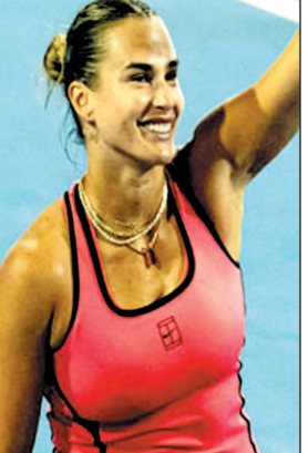
फ्लोरिडा/मियामी, 27 मार्च. मियामी ओपन 2026 अपने अंतिम चरण में पहुंच चुका है और अब टूर्नामेंट का रोमांच चरम पर है.