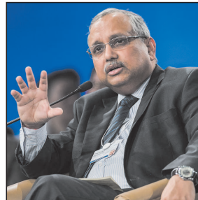
उद्योगों को मदद देने के लिए सरकार ने कई उपाय किए हैं। कच्चे तेल और मध्यवर्ती उत्पादों की कमी से आपूर्ति श्रृंखला प्रभावित