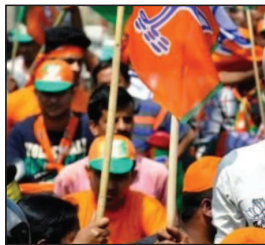
नहीं है, बल्कि यह आने वाले समय के लिए जनता के मूड को भांपने का एक बड़ा जरिया भी साबित होगा।

इन राज्यों की पांच महत्वपूर्ण सीटों पर भाजपा ने अपने ‘योद्धाओं’ के नाम तय कर दिए हैं, जो स्थानीय समीकरणों को ध्यान में रखते हुए चुने गए हैं। यह चुनाव केवल एक सीट जीतने की कवायद