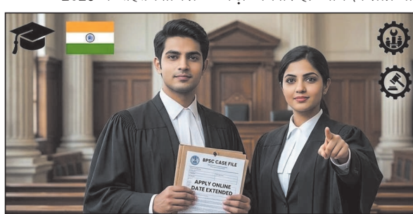
जज पदों पर भर्ती की अधिसूचना जारी की गई है. इस भर्ती के 25 फरवरी 2026 से शुरू हो चुकी है और अभ्यर्थी 30 अप्रैल 2026

माध्यम से कुल 173 पदों को भरा जाएगा, जो विधि क्षेत्र में करियर बनाने वाले युवाओं के लिए एक बड़ा अवसर है. आवेदन प्रक्रिया