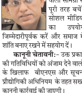
भवनानों को ठेस पहुंचाने वाली सामग्री से पूरी तरह बचें। सोशल मीडिया का उपयोग जिम्मेदारीपूर्वक करें और समाज में शांति बनाए रखने में सहयोग दें।