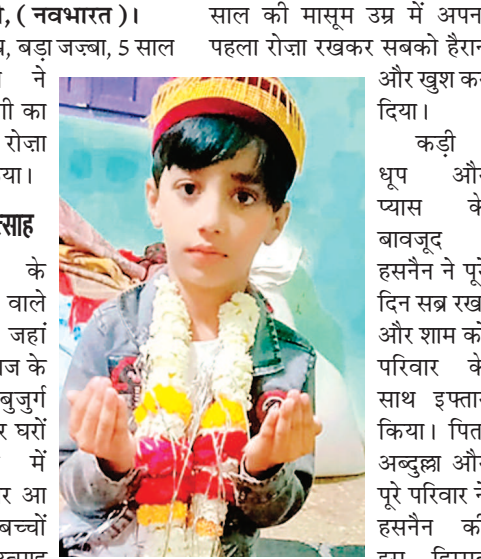
को सराहना की और उसके उज्वल भविष्य के लिए दुआएं मांगी।