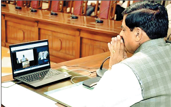
दीनदयाल उपाध्याय शोध संस्थान के कार्यक्रम को वरुंअल संबोधित करते हुए सीएम .

राज्य सरकार स्व. नानाजी देशमुख की शिक्षाओं के अनुरूप समाज और देश के संवर्धन तथा सशक्तिकरण की दिशा में कार्य कर रही है.