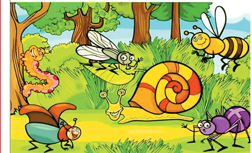
छात्रों को चुनौती देने के लिए हमने दो चित्र तैयार किए हैं जिनमें अंतर ढूँढना है।