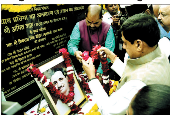
रोपा. इस दौरान उन्होंने कहा कि पंडित दीनदयाल उपाध्याय राष्ट्रीय स्वयंसेवक संघ के चिंतक, संगठनकर्ता और भारतीय जनसंघ

का प्रभावी प्रयास था। पं. दीनदयाल उपाध्याय एकात्म मानववाद और अंत्योदय के प्रणेता तथा समर्थ भारत निर्माण के चिंतक थे। मुख्यमंत्री डॉ. यादव पंडित दीनदयाल उपाध्याय की पुण्यतिथि पर लालघाटी स्थित उनकी प्रतिमा पर पुष्पांजलि अर्पित करने के बाद उपस्थित जनसमुदाय को संबोधित कर रहे थे। मुख्यमंत्री डॉ. यादव ने पं. दीनदयाल उपाध्याय की प्रतिमा के निकट विकसित नमो वन का अवलोकन कर रुद्राक्ष का पौधा