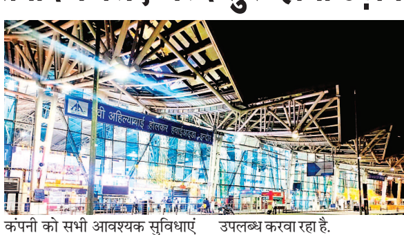
कंपनी को सभी आवश्यक सुविधाएं उपलब्ध करवा रहा है.