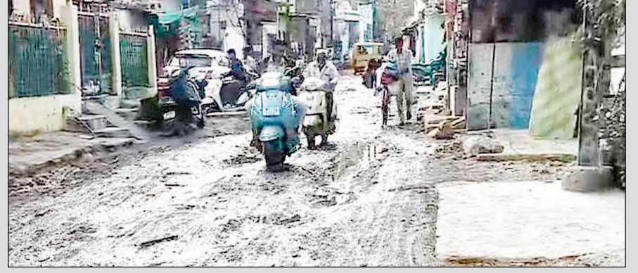
है, जो रोजाना इसी सड़क से आवागमन करने को मजबूर है. सड़क की स्थिति इतनी जर्जर हो चुकी है कि जगह-जगह बड़े-बड़े गड्ढे, उखड़ी हुई गिट्टी और उड़ती धूल लोगों की परेशानी का कारण बने हुए हैं. बरसात के मौसम में हालात और भी भयावह हो जाते हैं, जब गड्ढों में भरा पानी दुर्घटनाओं को न्यता देता है. आए दिन दोपहिया वाहन चालक फिसलकर गिरते रहते हैं. इससे कई लोग चोटिल हो चुके हैं, वहीं भारी वाहन असंतुलित होकर पलटने की घटनाएं भी सामने आ रही हैं. स्थानीय नागरिकों का आरोप है कि शिकायतों के बावजूद जिम्मेदार विभाग और जनप्रतिनिधि आंख मूंदे बैठे हैं. सवाल यह है कि क्या किसी बड़ी जनहानि के बाद ही प्रशासन जागेगा या फिर जनता यूं ही खस्ताहाल सड़क पर जान जोखिम में डालकर चल्ती रहेगी?

इंदौर. शहर में नगर निगम की अनदेखी और लापरवाही के कारण विकास कार्य सुस्त या आधे-अधूरे हैं, जिससे जनता परेशान है. प्रमुख समस्याओं में गंदा पानी, टूटी सड़कें, और अधूरे पुल शामिल हैं. इस वजह से रहवासियों को काफी समय से असुविधाओं का सामना करना पड़ रहा है. शहर की जनसमस्याओं को लेकर एक बार फिर वार्ड क्र.-1 से गंभीर मामला सामने आया है. यहां की मुख्य सड़क जो कई कॉलोनियों को जोड़ती है और एयरपोर्ट की ओर जाने वाला प्रमुख मार्ग भी है, पिछले कई वर्षों से बद्दहाली का शिकार बनी हुई है. इस मार्ग से जुड़ी कॉलोनियों में लगभग 90 प्रतिशत आबादी मजदूर वर्ग, मध्यम वर्ग और निम्न आय वर्ग की