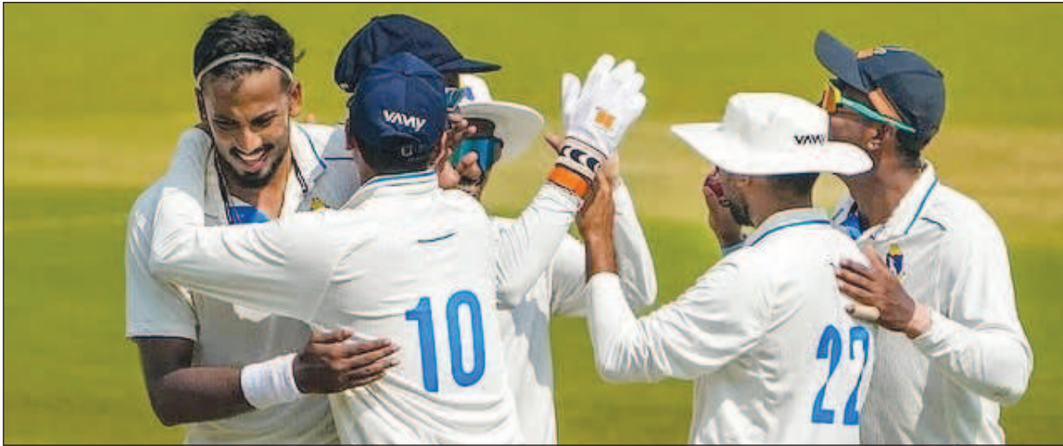
रणजी ट्रॉफी 2025-26 : सातवें राउंड के पहले दिन हाई-वोल्टेज मुकाबले