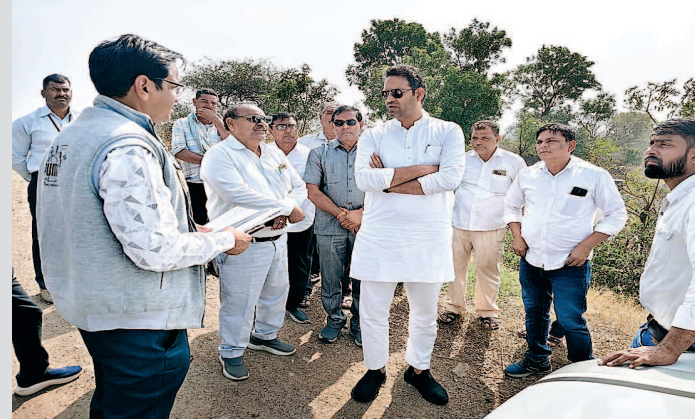
बाल्यापुर की मशीनरी, विद्युत आपूर्ति, संचालन व्यवस्था एवं जल वितरण क्षमता की जानकारी ली गई। किसानों ने बताया