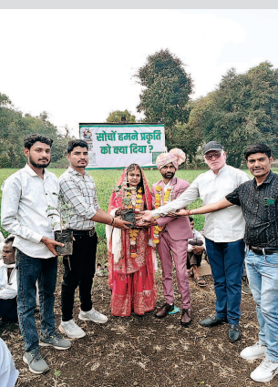
नहीं दिखी, नव-दंपतियों को दिए गए उपहार भी जीवन मूल्यों से जुड़े रहे।

पूजन एवं वेदी स्थापना के साथ हुई। गायत्री परिवार के विद्वान आचार्यों के मार्गदर्शन में सामूहिक गायत्री यज्ञ संपन्न कराया गया, जिसमें सभी 27 जोड़ों ने आहुतियां अर्पित कीं। मंत्रोच्चार के बीच पाणिग्रहण संस्कार सम्पन्न हुए। विशेष बात यह रही कि पंडितों द्वारा प्रत्येक फेरे का अर्थ एवं गृहस्थ जीवन के सात कर्तव्यों की सरल व्याख्या की गई, जिससे उपस्थित जनसमुदाय भावविभर हो उठा, सामूहिक विवाह सम्मेलन में सादगी और अनुशासन हर स्तर पर देखाई को मिला। सामूहिक भोज में हजारों समाजजनों ने कतारबद्ध होकर भोजन ग्रहण किया। व्यवस्थाएं इतनी सुव्यवस्थित रहीं कि कहीं भी अव्यवस्था