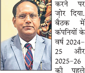
छमाही के वित्तीय और व्यावसायिक प्रदर्शन की समीक्षा की गयी. बैठक में भारतीय जीवन बीमा निगम (एलआईसी), भारतीय सामान्य बीमा निगम (जीआईसी), न्यू इंडिया एश्योरेंस कंपनी लिमिटेड, नेशनल इश्योरेंस कंपनी लिमिटेड, यूनाइटेड इंडिया इश्योरेंस कंपनी लिमिटेड, ओरिएंटल इश्योरेंस कंपनी लिमिटेड और एग्जीक्यूटिव इश्योरेंस कंपनी