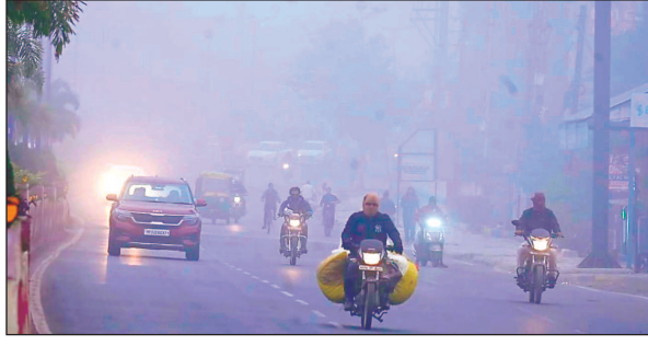
शनिवार को शहर कोहरे और कड़कड़ाती ठंड की चपेट में रहा. धूप न निकलने के कारण ठंडी हवाएं चुभती रही. न्यूनतम पारा भी 21.9 डिग्री तक पहुंच गया.

3 घंटे की देरी से सुबह 9.30 बजे इंदौर में उतरा पहला विमान