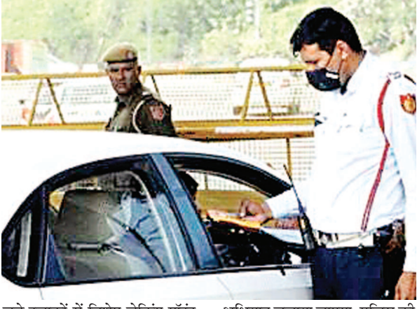
जुड़े इलाकों में विशेष चेकिंग पॉइंट बनाए जाएंगे. रात के समय लगातार पेट्रोलिंग के साथ ट्रिंक एंड ड्राइव अभियान चलाया जाएगा. पुलिस की योजना के तहत करीब तीन हजार से अधिक पुलिसकर्मी मैदान में तैनात