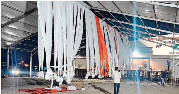
अधोसंरचना का लाभ मिलेगा.

मोहन यादव सोमवार को उज्जैन प्रवास पर रहेंगे. इस दौरान नानाखेड़ा क्षेत्र में एक भव्य कार्यक्रम आयोजित किया जाएगा, जिसमें मुख्यमंत्री द्वारा सिंहस्थ-2028 को ध्यान में रखते हुए शहर को लगभग 129 करोड़ रुपये के विकास कार्यों की सौगात दी जाएगी. कार्यक्रम में विभिन्न निर्माण कार्यों का भूमिपूजन एवं लोकार्पण किया जाएगा. मुख्यमंत्री डॉ. मोहन यादव का यह दौरा उज्जैन के विकास की दिशा में एक और मजबूत कदम माना जा रहा है. आने वाले समय में इन परियोजनाओं के पूर्ण होने से न केवल सिंहस्थ-2028 का सफल आयोजन सुनिश्चित होगा, बल्कि उज्जैन के नागरिकों को भी बेहतर सड़कें, सुविधाएं और आधुनिक