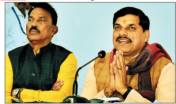
चिकित्सकीय परामर्श के एंटीबायोटिक दवाइयों का सेवन न करने की अपील करते हुए इसे

इस दौरान बड़ी संख्या में जनप्रतिनिधि और प्रशासनिक अधिकारी मौजूद रहे. कार्यक्रम में प्रधानमंत्री ने देशवासियों से बिना