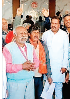
यह है कि गरीब परिवार अंधेरे में रहने को मजबूर हैं। हितग्राहियों ने बताया कि रात होते ही हालात और भयावह हो जाते हैं। दीपक और चिराग की रोशनी में जीवन कर रहा है, जिससे बच्चों की पढ़ाई बाधित हो रही है और महिलाओं व बुजुर्गों की सुरक्षा पर भी खतरा बना रहता है। आरोप है कि उद्घाटन समारोह के दौरान जनरेटर या अस्थायी व्यवस्था से लाइट जलाकर स्थिति को