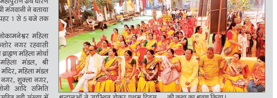
श्रद्धालुओं ने उपस्थित होकर प्रथम दिवस की कथा का श्रवण किया।