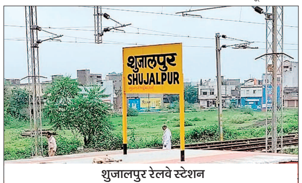
शुजालपुर रेलवे स्टेशन

सूत्रों के अनुसार रेलवे गेट के बाद ओवर ब्रिज निर्माण के लिए जो सेंट्रल लाइन निर्धारित की गई थी वह 5 मीटर रेलवे सीमा की और शिफ्ट हुई है, जिसका मानचित्र भी विभाग ने जारी करते हुए इस हिस्से में पुनः सर्वे करने के लिए निर्देश दिए हैं, जिसके परिणाम में टीम का गठन किया गया है. मिली जानकारी अनुसार लोक निर्माण विभाग के मंत्री ने शुजालपुर मंडी स्थित रेलवे समपार पर बनने वाले रेलवे ओवर ब्रिज के प्रस्ताव की रीविज के लिए निर्देशित किया था.