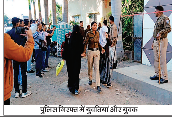
पुलिस गिरफ्त में युवतियां और युवक