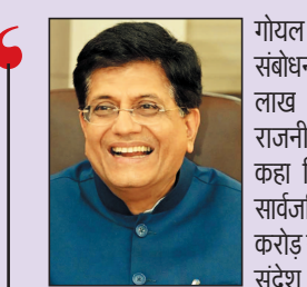
गोयल ने प्रधानमंत्री मोदी के स्वतंत्रता दिवस संबोधन का उल्लेख किया, जिसमें पीएम ने एक लाख युवाओं से सार्वजनिक जीवन और राजनीति में आने की अपील की थी. उन्होंने कहा कि देश को ईमानदार और समर्पित सार्वजनिक नेताओं की आवश्यकता है जो 140 करोड़ नागरिकों को कर्तव्य और जिम्मेदारी का संदेश दे सकें-पहले परिवार के लिए, फिर समाज के लिए और अंत में राष्ट्र के लिए. उन्होंने युवावाद दिया कि विश्वविद्यालय राजनीति और सार्वजनिक जीवन पर गहरी समझ विकसित करने में छात्रों की मदद करें और उन्हें जनप्रतिनिधियों के साथ इंटरैक्शन के अवसर भी दें ताकि वे शासन और सार्वजनिक सेवा को प्रत्यक्ष रूप से समझ सकें.

नई दिल्ली, 08 दिसंबर. एमिटी युनिवर्सिटी नोएडा के वार्षिक दीक्षांत समारोह में केंद्रीय वाणिज्य और उद्योग मंत्री पीयूष गोयल ने कहा कि किसी भी विश्वविद्यालय का सबसे बड़ा योगदान प्रतिभाशाली छात्रों को प्रोत्साहित करना, उनका विकास करना और उनकी क्षमताओं को सम्मान देने वाला मंच उपलब्ध कराना होता है.