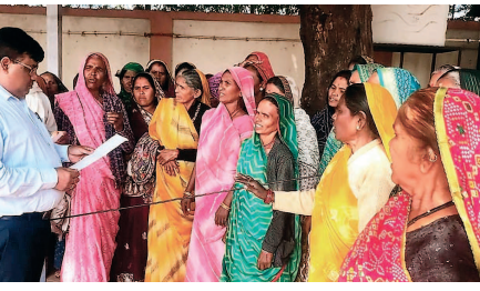
बीमारियों में जकड़े जाने पर परिवार उपचार कराने में समर्थ नहीं है। आर्थिक तंगी से गुजरना पड़ता है। कई लोगों की लगातार शराब पीने से मौत भी हो चुकी है।

खरगोन। जिले के ग्राम नीमखेड़ा की महिलाओं ने गांव में शराब बंदी की मांग को लेकर एकजुटता दिखाई है। मंगलवार को बड़ी संख्या में कलेक्टर पहुंची महिलाओं ने कलेक्टर के नाम सौंपे ज्ञापन में गांव में शराब बिक्री पर रोक लगाने की मांग की। महिलाओं का आरोप है कि गांव में अवैध शराब की बिक्री तेजी से बढ़ रही है। लोग दिनभर शराब पीकर हंगामा करते हैं, जिससे गांव की शांति भंग हो रही है। घर के पुरुष लड़ाई-झगड़ा कर महिलाओं के साथ मारपीट करते हैं, वहीं स्वास्थ्य पर भी विपरित असर पड़ रहा है। शराब पीने वाले