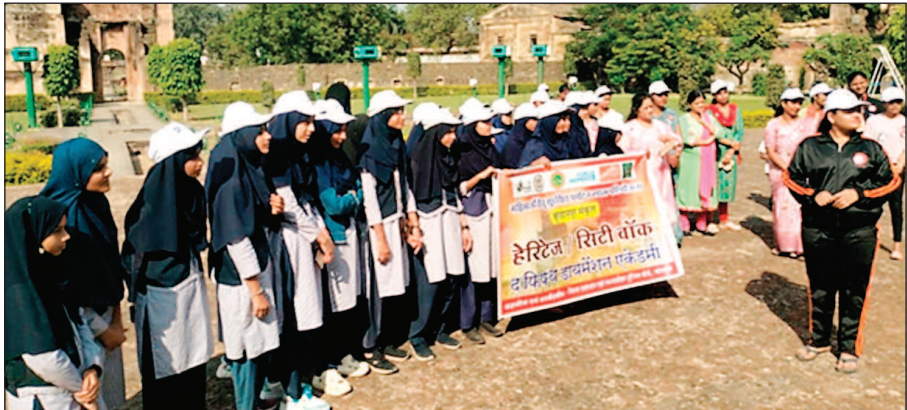
यह हेरिटेज वॉक का उद्देश्य महिलाओं को इतिहास की गहरी समझ देना और उन्हें रात में भी सुरक्षित रूप से बाहर