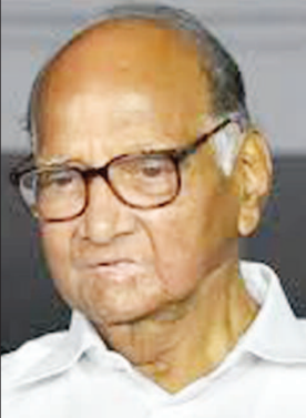
मुंबई. महाराष्ट्र की राजधानी मुंबई की सत्ता पर बीजेपी को काबिज होने से रोकने के लिए शरद पवार पावरगेम खेलेंगे. महाराष्ट्र में राज ठाकरे की अनुवाई वाली मनसे को लेकर

एमवीए की कमान शरद पवार ने अपने हाथों में ली. उद्धव ठाकरे की शिवसेना यूबीटी और कांग्रेस के बीच तलखी बढाने के बाद शरद पवार के खेमे से पावरगेम की तैयारी सामने आई है.