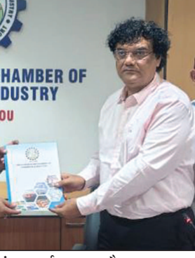
बनाने के लिए निरंतर कार्य कर रहा है. अहमदाबाद मंडल और गांधीधाम सब-डिवीजन की उत्कृष्ट उपलब्धियों वर्ष 2025-26 के पहले सात माह में 29.18 मिलियन टन माल परिवहन का उल्लेखनीय कीर्तिमान स्थापित किया गया है.