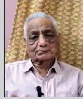
जोधपुर. पूर्व मुख्यमंत्री अशोक गहलोट के राजनीतिक गढ़ माने जाने वाले जोधपुर में कांग्रेस की अंदरूनी स्थिति को लेकर

मीडिया पोस्ट ने कांग्रेस संगठन में हलचल मचा दी है. उन्होंने अपने लंबे राजनीतिक अनुभव और पूर्व चुनावों के संदर्भ में अशोक गहलोट पर गंभीर आरोप लगाए हैं.