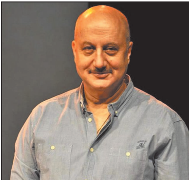
प्रतिनिधियों ने फिल्म को गर्मजोशी और उत्साह के साथ सराहा।

निर्देशन में बनी 'तन्वी द ग्रेट' पेश की। यह फिल्म ऑटिज्म स्पेक्ट्रम पर रहने वाली एक असाधारण लड़की की कहानी है, जो गलत समझे जाने के बावजूद अपने सैन्य अफसर पिता के कदमों पर चलते हुए आर्मी में शामिल होने का सपना पूरा करने को राह पर निकलती