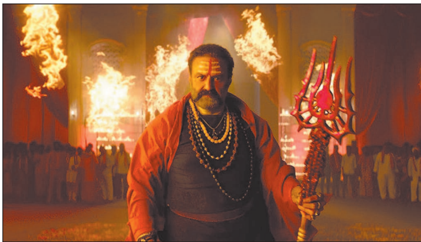
कन्नड सुपरस्टार शिव राजकुमार विशेष अतिथि के रूप में मौजूद रहे। उनकी उपस्थिति ने कार्यक्रम को और भी गरिमामय बना दिया। ट्रेलर की शुरुआत एक चेतावनी भरे माहौल से