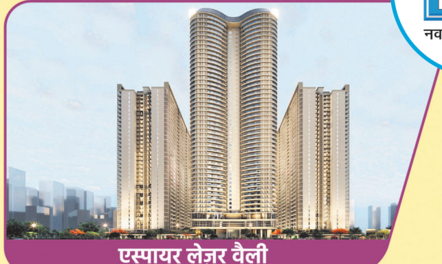
एस्पायर लेज़र वैली