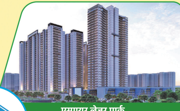
एस्पायर लेज़र पार्क