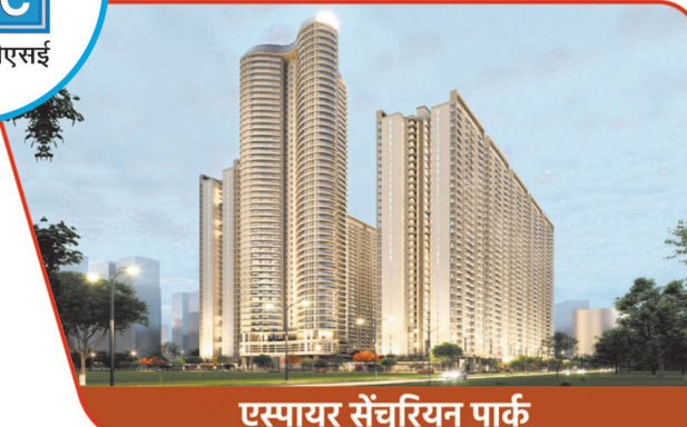
एस्पायर संचुरियन पार्क