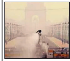
इंडिया गेट का प्रदर्शन किसी संगठन या एनजीओ ने नहीं किया था, वह स्वयंस्फूर्त था. स्वच्छ हवा में सांस लेने का अधिकार जीवन के अधिकार से जुड़ा हुआ है. वायु प्रदूषण पर नियंत्रण पाने के ठोस उपाय किए जाने चाहिए.

स्वच्छ वायु में सांस लेना हर व्यक्ति का अधिकार है. ऐसी व्यवस्था किस काम की जो जनता को भयानक वायु प्रदूषण से निजात न दिला सके? देश की राजधानी दिल्ली के लिए कलंक है कि वह गैस चेम्बर बन गई है. इसकी वजह से हर वर्ष मृत्युएं हैं लाखों लोगों की वृद्धि हो जाती है. ठंड के मौसम में दिल्ली का वायु गुणवत्ता सूचकांक (एयूआई) 400 से ऊपर चला जाता है. इस समय जनक्रांति बहुत बढ़ गया है तभी तो सैकड़ों लोगों ने इंडिया गेट पर प्रदर्शन किया. इनमें बच्चे अपने पालकों के साथ शामिल हुए. बैनर लिए छात्र और बुजुर्ग भी स्वच्छ हवा की मांग करने वालों में आगे थे. दिल्ली के वायु प्रदूषण को लेकर राजनेता मौसम की दुहाई देते हैं या पराली जलाने की वजह से पड़ोसी राज्य से आ रहे हैं, जो जिम्मेदार से बर्तते हैं. इसके अलावा वाहनों से निकलने वाले उत्सर्जन, उद्योगों के धुएँ, निर्माण कार्यों से उठने वाले धूल के गुबार का कारण पेश किया जाता है. कारण बताते वाले समाधान नहीं निकालते. इसका दुष्परिणाम दिल्लीवासियों के स्वास्थ्य पर हो रहा है. यह जनस्वास्थ्य के लिए आपातकाल है. लोगों के फेफड़े जहरीले धुएँ से नाकाम होते जा रहे हैं जिसका डॉक्टर भी इलाज नहीं