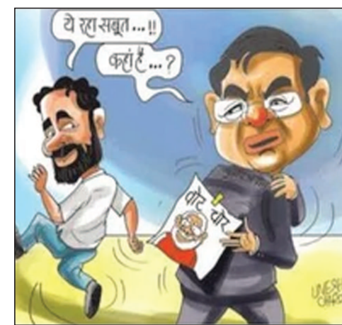
काम है जो वह आरोप लगाने के बाद खिसक जाते हैं? पीएम मोदी को देखिए जिनके बारे में बीजेपी नेताओं का दावा है

हमने कहा, 'राहुल की यही शैली है. चुनाव आयोग पर गंभीर आरोप का मिर्ची पाउडर छिड़को और वहां से चल दो. इधर चुनाव आयोग और बीजेपी नेता तिलमिलाने हैं और उधर राहुल जाकर लड्डु या जलेबी बनाते हैं. मछुआरों के साथ तालाब में मछली पकड़ते हैं. उनके पास इतना फालतू वक्त नहीं है कि एफडेविट दाखिल करें और फिर कोर्ट-कचहरी का चक्कर लगाते रहें. राहुल को जनता की अदालत पर भरोसा है. वह अपने तरीके से चुनाव आयोग और बीजेपी पर सर्जिकल स्ट्राइक करते हैं. वह वोट चोरी को लेकर सीधे कहते हैं कि गोलमाल है, भाई सब गोलमाल है!' पड़ोसी ने कहा, 'निशानेबाज, राहुल को ऐसा कौन सा