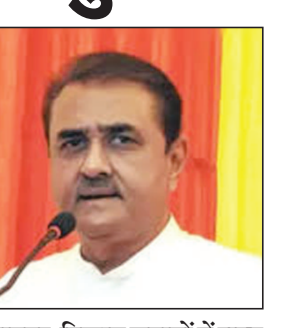
नागपुर. निकाय चुनावों में राज्य

शिवसेना-एनसीपी में पकी खिचड़ी, महायुति में फूट के संकेत दोनों ही गठबंधनों में शामिल दलों का एक साथ मिलकर चुनाव लड़ना संभव नहीं लग रहा है। महायुति की सत्ता राज्य में है और उसमें शिंदे शिवसेना और एनसीपी अजित पवार गुट शामिल हैं। लोकसभा व विधानसभा चुनाव तो बीजेपी के साथ