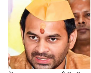
में अब सवाल उठ रहा है कि क्या बिहार चुनाव के बाद तेज प्रताप यादव बिहार चुनाव के बाद एनडीए के साथ जाएंगे।

पटना में रवि किशन के साथ नजर आए पटना. बिहार विधानसभा चुनाव के बीच पटना से एक हेरान करने वाली तस्वीर सामने आई है। तेज प्रताप यादव पटना एयरपोर्ट पर बीजेपी सांसद रवि किशन के साथ नजर आए हैं। तेज प्रताप यादव ने कहा है कि बिहार का जो विकास करेगा वह उसके साथ हैं वहीं सांसद रवि किशन ने कहा है कि भोलेनाथ के भक्तों के लिए बीजेपी के दरवाजे हमेशा खुले हुए हैं। ऐसे