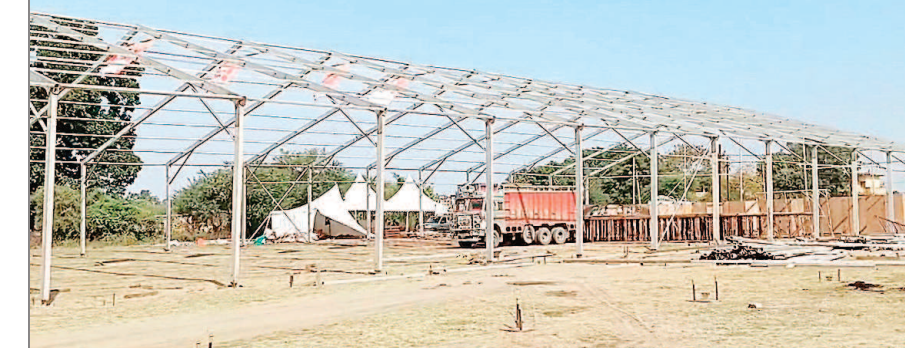
लेकर प्रशासन और नगर परिषद की तैयारियां जोरों पर हैं. मकसी नगर के

मकसी, 11 नवंबर. मुख्यमंत्री डॉ. मोहन यादव 14 नवंबर को मकसी आगमन पर करोड़ों रुपये के विकास कार्यों का भूमि पूजन करेंगे. इस दौरान लगभग 8000 करोड़ रुपये की लागत से बनने वाले जैक्सन औद्योगिक सोलर प्लांट, मकसी-उज्जैन फोरलेन रोडलागत 273 करोड़ 45 लाख रुपये तथा मकसी नगर फोरलेन रोड लागत 33 करोड़ 71 लाख रुपये के निर्माण कार्यों की नींव रखी जाएगी.