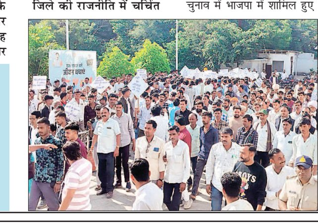
जिले की राजनीति में चर्चित