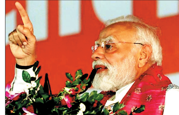
पंद्रह साल के जंगलराज का रिपोर्ट कार्ड शून्य बट्टे सन्नाटा

उन्होंने कहा कि पिछले दिनों जब इस बात की पोल खोली गई कि कांग्रेस प्रदेश में राजद को बर्बाद करना चाहती है, तो उसके बाद दोनों पक्षों की तनाती बढ़ गई। उन्होंने कहा राजद के नेताओं ने कांग्रेस की कनपटी पर कट्टा रख कर मजबूर किया कि उनके नामदार नेता को मुख्यमंत्री पद का चेहरा घोषित किया जाए। उन्होंने कहा कि जिस तरह अपनी रैलियों में राजद और कांग्रेस एक दूसरे का नाम लेने से परहेज कर रहे हैं, उससे पता चलता है कि सबकुछ ठीक नहीं है। चारों तरफ भारी संख्या में राजद के पोस्टर लगे हुए हैं, लेकिन उनमें कांग्रेस के नामदार का चेहरा दूरबीन से भी नहीं दिख रहा है।