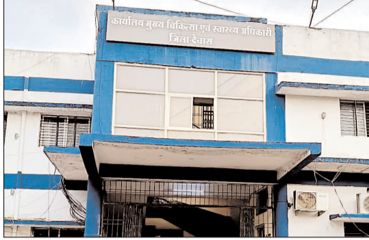
दवाइयों दे रहे हैं, जिससे आम लोगों के स्वास्थ्य पर गंभीर खतरा

पैथोलॉजी से कमीशन लेकर चल रहा फर्जी इलाज का धंधा