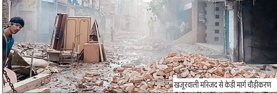
खजूरवाली मस्जिद से केडी मार्ग चौड़ीकरण

बावजूद चौड़ीकरण को आने वाले भविष्य के लिए सुखमय तस्वीर बताया है. खजूरवाली मस्जिद से बड़े पुल तक-शहर के एक महत्वपूर्ण और व्यस्त मार्ग, खजूरवाली मस्जिद से केडी गेट, जूना सोमवारिया होते हुए शिप्रा बड़े पुल तक, चौड़ीकरण का कार्य नागरिकों की अभूतपूर्व स्वैच्छिक सहभागिता के साथ प्रारंभ हो गया है. इस मार्ग को लगभग 18 मीटर (करीब 60 फीट) चौड़ा कर 4-लेन