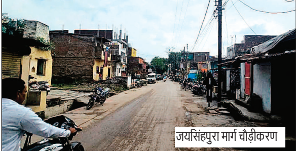
जयसिंहपुरा मार्ग चौड़ीकरण

नवभारत न्यूज उज्जैन. तिनका-तिनका जोड़कर जिन्होंने अपने आशियाने बनाए थे, वह मकान मालिक आज अपने ही हाथों से अपने मकान न सिर्फ तोड़ रहे हैं, बल्कि जिला प्रशासन से लेकर मध्यप्रदेश सरकार का विकास के तहत आभार भी प्रकट कर रहे हैं. आने-वाले भविष्य के बारे में इस चौड़ीकरण की योजना को मिल का पथर बता रहे हैं. महाकाल के नगरी उज्जैन से दो तस्वीर सामने आई हैं