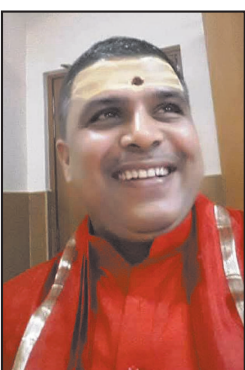
आचार्य टेकनरानजन उपाध्याय विरह अर्थक श्रीकृष्ण विद्यालय मंदिर, वाराणसी

कूटनीति एक गतिशील और बहुआयामी प्रक्रिया है. तालिबान प्रशासित अफगानिस्तान में भारत के तकनीकी मिशन को दूतावास में बदलने के निर्णय से यह स्पष्ट हो गया है कि बदलते वैश्विक परिदृश्य में कूटनीति अपेक्षाकृत ज्यादा व्यावहारिक और यथार्थवादी हो गई है और भारत ने भी इसे स्वीकार कर लिया है. अफगानिस्तान को जोड़ने वाला एक महत्वपूर्ण सेतु है. इसी कारण यह क्षेत्रीय संपर्क, व्यापार मार्गों और सामरिक संतुलन में विशेष भूमिका निभाता है. अफगानिस्तान के इसी महत्व को दृष्टिगत रखते हुए भारत उस तक अपनी पहुंच सुनिश्चित करना चाहता है. 2021 में तालिबान की सत्ता में वापसी को पाकिस्तान की लिए बेहतर स्थिति माना गया था लेकिन भारत ने राजनीतिक दूरदर्शिता दिखाते हुए तालिबान से सीमित संवाद बनाए रखा तथा पूर्व की तरह ही अफगानिस्तान को मानवीय सहायता देना भी जारी रखी. इसके बेहतर परिणाम अब सामने आ रहे हैं. तालिबान और भारत के बीच बढ़ते राजनयिक सम्बन्धों तथा अफगानिस्तान और पाकिस्तान की सेना के बीच डूरंड रेखा पर हुए भीषण संघर्ष को शांति संतुलन को दृष्टि से महत्वपूर्ण माना जा रहा है. इसे भारत के लिए राजनीतिक बढ़त तथा पाकिस्तान के लिए राजनीतिक चुनौती की तरह देखा जा रहा है.