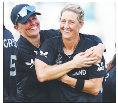
अनकहा एहसास था कि यह वनडे में उनका आखिरी अध्याय था। अनगिनत लड़ाइयों और साझा जीतों पर आधारित यह सौहार्द किसी भी मैच-जिताऊ पारी से कहीं ज्यादा चमकीला था। अपने करियर पर विचार करते हुए, डिवाइन की आवाज में विनम्रता और गर्व दोनों झलक रहे थे।

विशाखापत्तनम, 26 अक्टूबर. महिला क्रिकेट के इतिहास में दर्ज हो जाने वाले इस दिन, एसीए-वीडीसीए क्रिकेट स्टेडियम न केवल इंग्लैंड और न्यूजीलैंड के बीच मुक़ाबले का, बल्कि इस खेल की सबसे अदम्य हस्तियों में से एक सोफी डिवाइन की मार्मिक विदाई का भी गवाह बना। न्यूजीलैंड के राष्ट्रगान की धुनें गुंजने लगीं, तो डिवाइन की आँखों में लगभग दो दशकों के क्रिकेट के संघर्ष और विजय का भाव झलक रहा था। कुछ आँसु थे, हालाँकि उम्मीद के मुताबिक नहीं, लेकिन एक करियर के अंत की मार्मिकता को बर्दाश्त करने के लिए पर्याप्त थे। प्रशंसकों की गर्जना सम्मान में दब गई, और खेल एक ऐसे पल के लिए रुक गया जो किसी भी स्कोरकार्ड से बड़ा था। यह एक युग का अंत था। अपनी सबसे करीबी साथियों, सुजी बेट्स और ली ताहू के साथ मैदान साझा करने से भावनाओं में और भी निखार आया। डिवाइन, जिन्होंने वर्षों तक इन साथियों के साथ गेंदबाजी और बल्लेबाजी की थी, ने हर पल का भरपूर आनंद लिया। हँसी थी, कुछ व्यंग्यात्मक मुस्कानें थीं, और यह