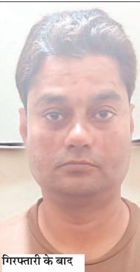
गिरफ्तारी के बाद

फिनाइल पी ली थी. इस सनसनीखेज घटना के बाद पुलिस ने आरोपियों के खिलाफ तहत