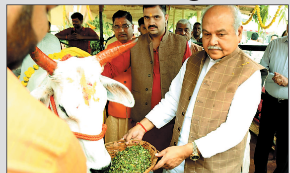
अध्यक्ष नरेन्द्र सिंह सहित अन्य अतिथिगणों एवं बड़ी संख्या में पहुंचे श्रद्धालुओं ने पूजन किया। विधानसभा अध्यक्ष ने इस अवसर पर कहा कि हमारी

108 टन गोबर से निर्मित गोवर्धन भगवान का हुआ पूजन नवभारत न्यूज ग्वालियर। मध्यप्रदेश की सबसे बड़ी आदर्श गौशाला में गोवर्धन भगवान का भव्य पूजन कार्यक्रम आयोजित हुआ। गौशाला परिसर में 108 टन गोबर से निर्मित गोवर्धन पर्वत और और इन्हें पर्वत पर गोबर व प्राकृतिक रंगों से निर्मित भगवान श्रीकृष्ण की प्रतिमा की वैदिक मंत्रोच्चार के बीच विधानसभा