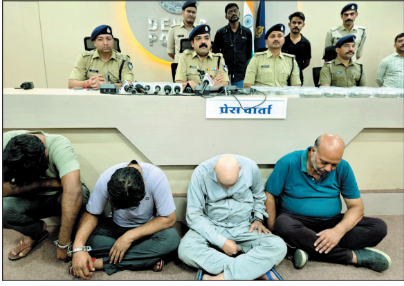
उत्तरप्रदेश, राजस्थान और छत्तीसगढ़ सहित कई राज्यों के प्रॉपर्टी ब्रोकर्स से संपर्क साधते थे. वे खुद को जमीन मालिक बताकर

पुलिस ने उत्तराखण्ड राज्य के रुड़की से गिरोह के पाँच शांति सदस्यों को गिरफ्तार कर उनके कब्जे से 29 लाख 50 हजार रुपये नकद और दो लक्जरी कारें जब्त की हैं। आरोपी जस्ट डायल वेबसाइट के जरिए देश के विभिन्न राज्यों के प्रॉपर्टी ब्रोकर्स को कम दामों पर जमीन बेचने का झांसा देकर ठगी किया करते थे। गिरोह के सदस्य मध्यप्रदेश, महाराष्ट्र,