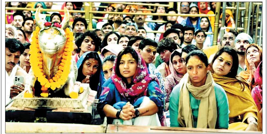
महिला क्रिकेट टीम के सदस्यों ने किए श्री महाकाल के दर्शन

उज्जैन. भारतीय महिला क्रिकेट टीम एवं कोचिंग स्टाफ के सदस्यों ने आज तड़के मध्यप्रदेश के उज्जैन स्थित भगवान महाकालेश्वर मंदिर में होने वाली भस्म आरती में शामिल होकर श्री महाकाल के दर्शन किये. क्रिकेट महिला टीम एवं कोचिंग स्टाफ के सदस्य तड़के श्री महाकालेश्वर मंदिर पहुंचे और भगवान के दर्शन कर भस्म आरती में सम्मिलित होकर आशीर्वाद प्राप्त किया. टीम के प्रमुख सदस्यों में कप्तान हरमनप्रीत कौर, उपकप्तान स्मृति मंधाना, प्रतिका रावल, हर्लीन देवोल, दीपि शर्मा, रेणुका सिंह ठाकुर, अरुंधति रेड्डी, राधा यादव, चरणी सहित अन्य खिलाड़ी एवं कोचिंग सदस्य उपस्थित रहे.