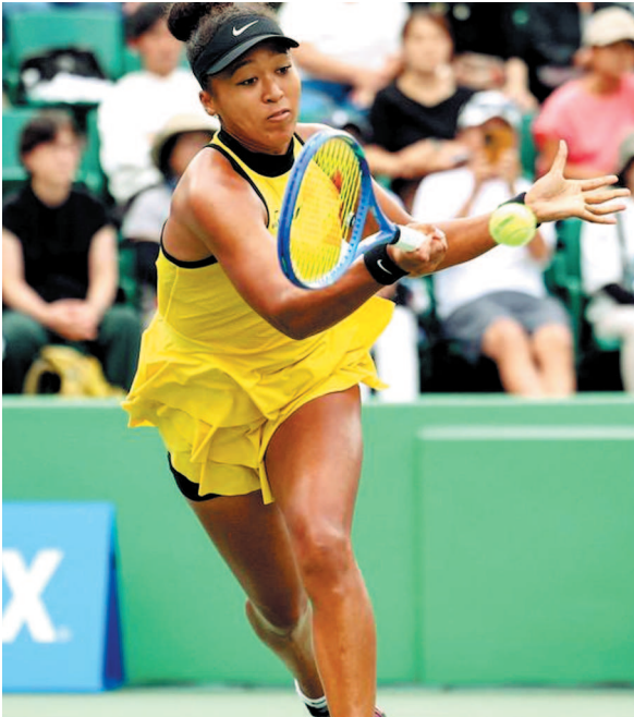
ओसाका ने स्वीकारा कठिन मुकाबला

मैच के बाद ओसाका ने ऑन-कोर्ट इंटरव्यू में कहा, यह यकीनन बहुत मुश्किल था। मैं अपने रवैये के लिए माफ़ी चाहती हूँ, चोट के कारण उनका यह इंटरव्यू जल्दी समाप्त करना पड़ा।