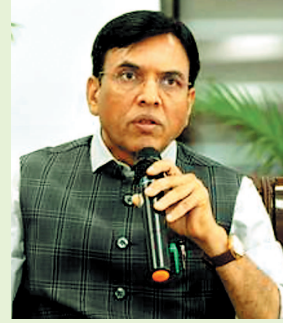
पारदर्शिता और जवाबदेही सुनिश्चित करना, खिलाड़ियों के

नई दिल्ली, 15 अक्टूबर, युवा मामले एवं खेल मंत्रालय (एमवाईएस) ने राष्ट्रीय खेल प्रशासन से जुड़े तीन मसौदा नियम जारी किए हैं और इन पर आम जनता व हितधारकों से प्रतिक्रिया मांगी है। ये मसौदे राष्ट्रीय खेल प्रशासन (राष्ट्रीय खेल निकाय) नियम, राष्ट्रीय खेल प्रशासन (राष्ट्रीय खेल बोर्ड) नियम और राष्ट्रीय खेल प्रशासन (राष्ट्रीय खेल न्यायाधिकरण) नियम के नाम से तैयार किए गए हैं। मंत्रालय के अनुसार, ये नियम राष्ट्रीय खेल प्रशासन विधेयक, 2025 के कार्यान्वयन को सुगम बनाने के लिए तैयार किए गए हैं। इस विधेयक को 11 अगस्त को लोकसभा और 12 अगस्त को राज्यसभा से पारित किए जाने के बाद 18 अगस्त को राष्ट्रपति की स्वीकृति प्राप्त हुई थी। इस विधेयक का उद्देश्य खेल निकायों के प्रशासन में