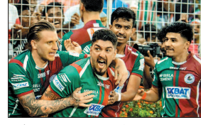
मोहन बागान ने फाइनल में बनाई जगह

अंतिम सेट में लगी चोट: पूर्व वर्ल्ड नंबर एक ओसाका निर्णायक सेट में 5-0 से आगे चल