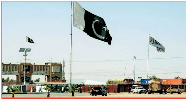
हथियार डालो, वरना अमेरिका करेगा कार्रवाई: ट्रंप

दुर्भाग्यपूर्ण है कि पाकिस्तान की इस क्रूर कार्रवाई में मासूम नागरिकों की जान गई. इस हमले के बाद तालिबान ने पाकिस्तान के खिलाफ जवाबी कार्रवाई की, जिसमें अफगान सेनाओं ने पाकिस्तानी सीमाई चौकियों और सैन्य टिकानों पर हमला किया. तालिबान का दावा है कि उन्होंने पाकिस्तानी सैनिकों को मार गिराया, हथियार और टैंक जब्त किए, और कुछ प्रमुख चौकियों पर कब्जा भी कर लिया. पाकिस्तान व अफगानिस्तान ने स्थानीय समयानुसार शाम 6 बजे से शुरू होकर अगले 48 घंटों तक के लिए अस्थायी युद्धविराम पर सहमत जताई है.