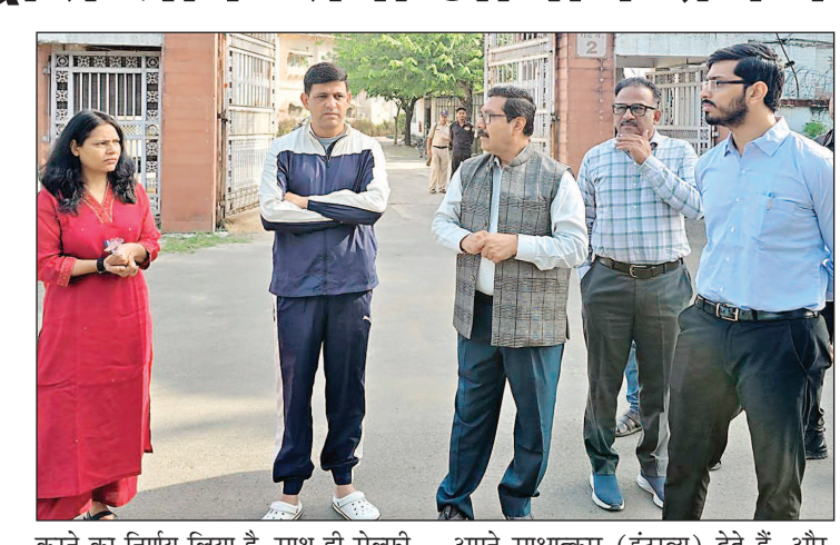
करने का निर्णय लिया है. साथ ही सेल्फी प्वाइंट और ट्रैफिक व्यवस्था को भी दुरुस्त करने के योजना बनाई जाएगी. ज्ञात हो कि देशभर से हजारों अभ्यर्थी हर वर्ष इंदौर एमपीपीएससी कार्यालय आते हैं. यहाँ वे अपने साक्षात्कार (इंटरव्यू) देते हैं, और भविष्य में देश सेवा में योगदान देते हैं. शहर में रेसीडेंसी क्षेत्र का यह इलाका पूरे प्रदेश की प्रशासनिक पहचान का प्रतीक है. महापौर ने अधिकारियों से कहा कि शहर में आने वाले

नव भारत न्यूज इंदौर. शहर एक रेसीडेंसी इलाके में स्थित मध्य प्रदेश लोक सेवा आयोग चौराहे का नगर निगम द्वारा सौंदर्यीकरण किया जाएगा. साथ ही उक्त चौराहे पर यातायात व्यवस्था और सेल्फी प्वाइंट का निर्माण करने की योजना बनाने के निर्देश दिए गए हैं. आज महापौर पुष्पमित्र भार्गव ने आज लोक सेवा आयोग क्षेत्र का दौरा किया. दौरे के दौरान महापौर ने शहर में रेसीडेंसी क्षेत्र (राजा बख्तावर सिंह मार्ग) स्थित मध्य प्रदेश लोक सेवा आयोग (एमपीपीएससी) कार्यालय चौघाट और आसपास के इलाके का जल्द ही पुनर्निर्माण और सौंदर्यीकरण