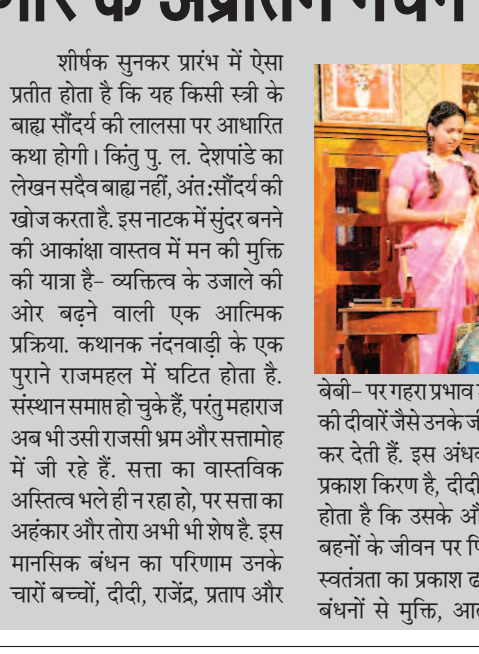
बेबी- पर गहरा प्रभाव डालता है. महल की दीवारें जैसे उनके जीवन को भी कैद कर देती हैं. इस अंधकार में एकमात्र प्रकाश किरण है, दीदी। उसे यह बोध होता है कि उसके और उसके भाई-बहनों के जीवन पर पिता की छाया ने स्वतंत्रता का प्रकाश ढक दिया है. वह बंधनों से मुक्ति, आत्मसम्मान और

शोर्षक सुनकर प्रारंभ में ऐसा प्रतीत होता है कि यह किसी स्त्री के बाह्य सौंदर्य की लालसा पर आधारित कथा होगी। किंतु पु. ल. देशपांडे का लेखन सदैव बाह्य नहीं, अंतःसौंदर्य की खोज करता है. इस नाटक में सुंदर बनने की आकांक्षा वास्तव में मन की मुक्ति की यात्रा है- व्यक्तित्व के उजाले की ओर बढ़ने वाली एक आत्मिक प्रक्रिया. कथानक नंदनवाड़ी के एक पुराने राजमहल में घटित होता है. संस्थान समाप्त हो चुके हैं, परंतु महाराज अब भी उसी राजसी भ्रम और सतामोह में जी रहे हैं. सत्ता का वास्तविक अस्तित्व भले ही न रहा हो, पर सत्ता का अहंकार और तोरा अभी भी शेष है. इस मानसिक बंधन का परिणाम उनके चारों बच्चों, दीदी, राजेंद्र, प्रताप और