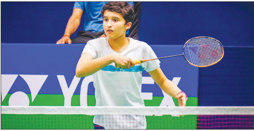
बीडब्ल्यूएफ वर्ल्ड जूनियर चैंपियनशिप 2025