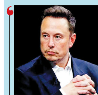
मंच में भी पक्षपात की संभावना हो सकती है।

नई दिल्ली, 05 अक्टूबर. टेस्ला और स्पेसएक्स के प्रमुख एलन मस्क ने घोषणा की है कि उनकी कृत्रिम बुद्धिमत्ता कंपनी द्वारा तैयार किया गया ज्ञान मंच 'ग्रीकीपीडिया' का प्रारंभिक बीटा संस्करण दो महीने में जारी किया जाएगा। मस्क का कहना है कि यह मंच विकिपीडिया का सशक्त विकल्प साबित होगा। एलन मस्क ने सामाजिक मंच पर एक उपयोगकर्ता की पोस्ट साझा की, जिसमें 'ग्रीकीपीडिया' को मनुष्यों और कृत्रिम बुद्धिमत्ता के लिए दुनिया का सबसे बड़ा और सबसे सटीक ज्ञान स्रोत बताया गया था। जानकारी के अनुसार, यह मंच विकिपीडिया जैसे स्रोतों का विश्लेषण करने के लिए उन्नत गणनात्मक प्रणाली