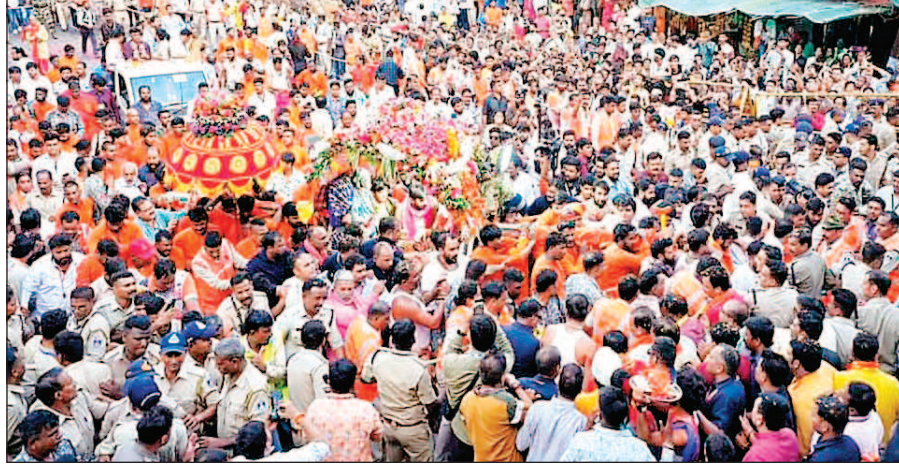
मंचों के माध्यम से बाबा महाकाल की पालकी का स्वागत सत्कार किया जाता है, एक-एक मंच पर

दरअसल दशहरे पूर्व पर वर्ष में एक बार बाबा महाकाल की पालकी पुराने शहर से नए शहर फ्रीगंज होते हुए दशहरा मैदान तक आती है। इसके लिए हजारों स्वागत